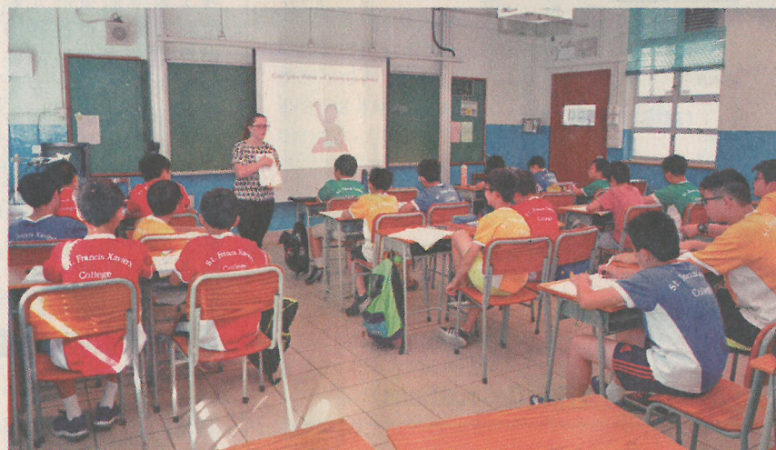
■創校逾六十年的聖芳濟書院，今年九月在中一及中二級推行小班教學，增加對學生的關顧。

project)，由校方出資，讓學生必須在體育、音樂或藝術之中，選擇有興趣的範疇學習，讓來自不同階層的學生，也有機會發展其多元智能，避免基層學生因經濟問題，失去發展不同興趣的機會。